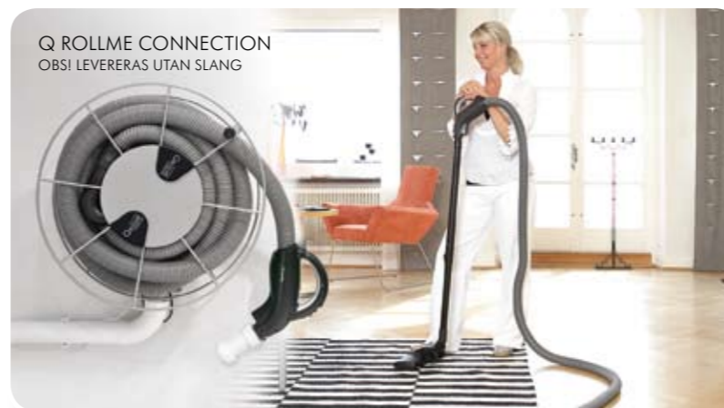
Q ROLLME CONNECTION OBS! LEVERERAS UTAN SLANG

Q TOOL SLINKY TELESKOPLANG MED HANDTAG. LÄNGD FRÅN 1,5 M TILL 7,5 M. PRAKTISK UPPHÄNGNINGS- ANORDNING MEDFÖLJER.