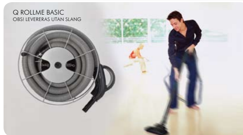
Q ROLLME BASIC OBS! LEVERERAS UTAN SLANG

Q TOOL ROLLME. ETT GENIALT ENKELT SÄTT ATT HÅLLA ORDNING PÅ STÄD- SLANGEN. RULLA UPP ELLER UT PÅ ETT PAR SEKUNDER. Q ROLLME CONNECTION ANSLUT DIREKT TILL RÖRSYSTEMET, Q BASIC UTAN ANSLUTNING. BÅDA KAN MONTERAS DIREKT MOT VÄGG ELLER I STÄDGARDEROB. PATENTSÖKT.